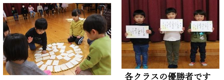
各クラスの優勝者です

建国記念式典・音楽会について(以上児クラス) 期日 2月11日(日) 10時～ 登園時間 9時40分 服装 男児—白のカッターシャツ 女児—白のブラウス 男女共に(園児服)・園児ズボン・紺ハイソックス着用 寒くないように防寒対策をよろしくお願いします。 ※詳細は、別紙プリントにてお知らせします。